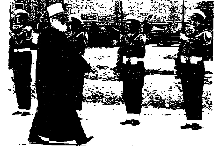
سبلحة شيخ المثل لدى وصوله الى القصر

اعلان سبلحة الشيخ محمد ابو خنفر ، بعد زيارة للقصر قبل ظهر امس ، انه لس لدى الرئيس مسكين ترقية كل منهم ووضي واخلاص ، لكن الحالة تبقى صعبة . وقد وصل سبلحة شيخ عقل الدروز الى بعبدا ، في الساعة العاشرة ، واستمرت وعرض خلالها على الرئيس ترقية الوضع الحكومي ، ونظرات الحالة الداخلية . وقد رضى معارضو الحكومة للجدية اقتراح الدعوة الى عقد مؤتمر وطني في القصر الجمهوري للاطلاع على اسس